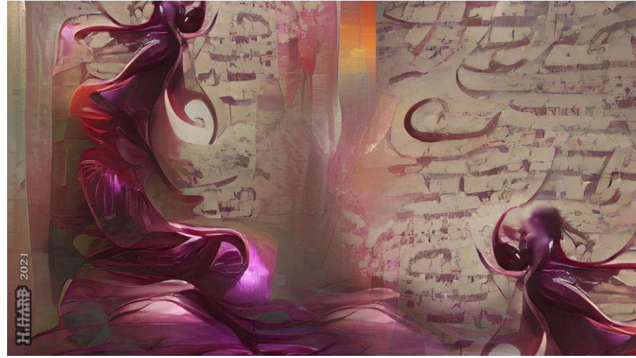
بعض من معرض : لوحات علوم القدرات