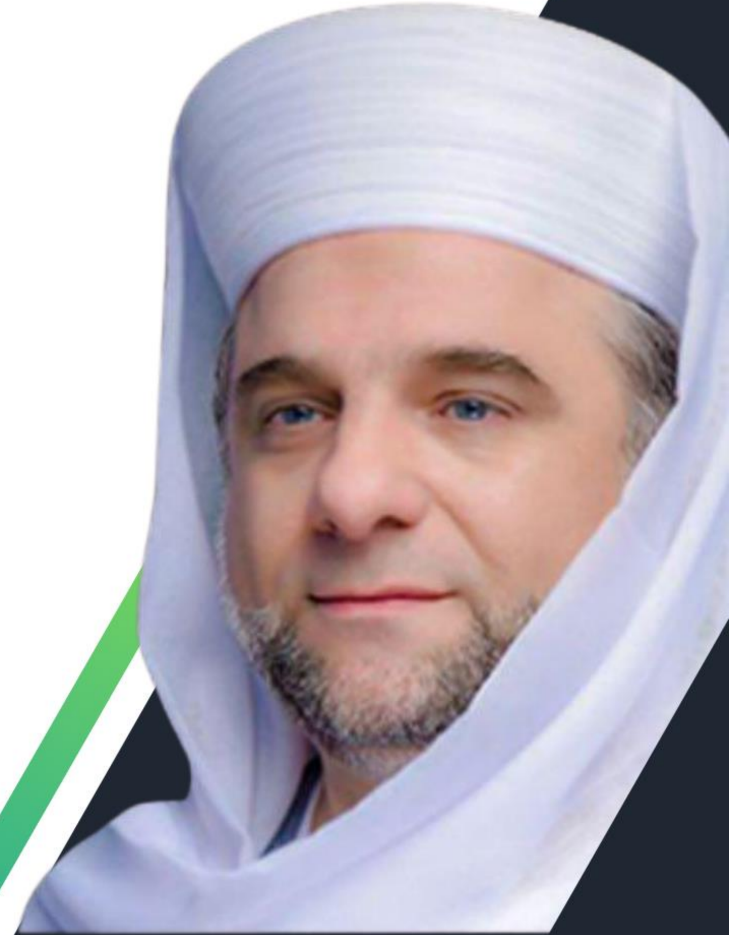
المفكرّ الدمشقي الشيخ د. هانيبال يوسف حرب